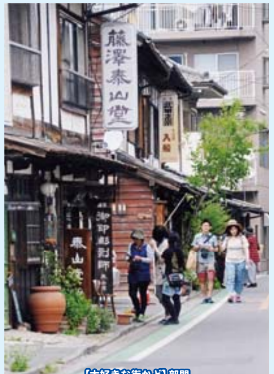
【大好きな街かど】部門 休日の買継ぎ通り 黒米賢二氏(入間市)