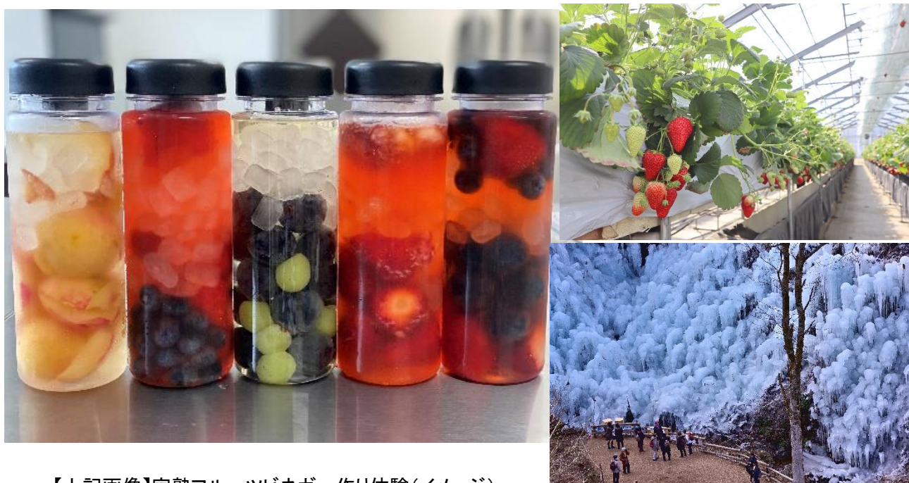
【上記画像】完熟フルーツピネガー作り体験(イメージ)