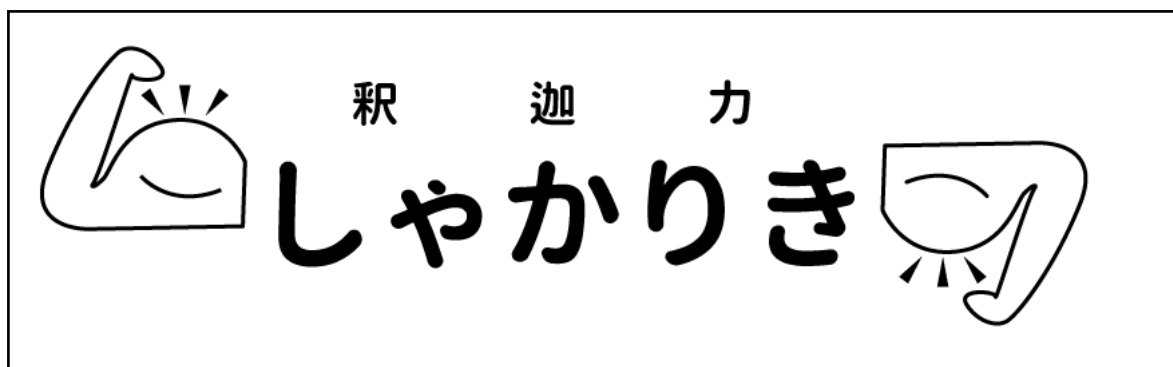
■寺院向け FC 事業「しゃかりき(釈迦力)」のロゴマーク