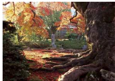
【第2回写真コンテスト 最優秀賞】