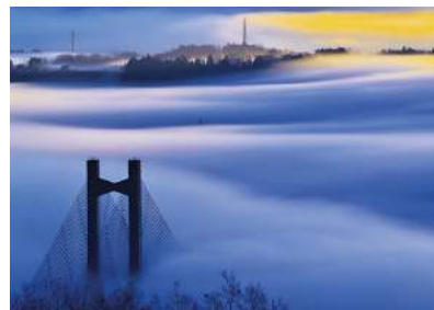
【第2回写真コンテスト 優秀賞】 秩父観光協会会長賞