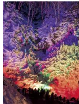
【第2回写真コンテスト 優秀賞】 秩父商工会議所会頭賞