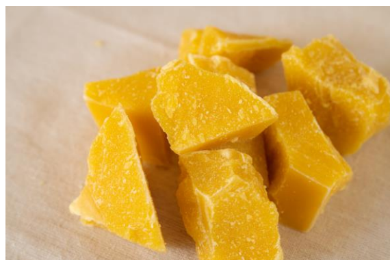
■「蜜乃潤」 左から 90g 35g 10g ■ミツバチの巣を溶かした塊(蜜蝋)