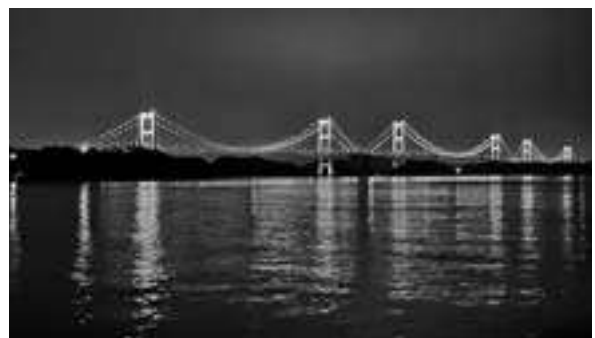
大島と四国を繋ぐ「来島海峡大橋」

がありましたら1度「夢の街道」にチャレンジしてみたいかがでしょうか。(アルコールカメラマン)