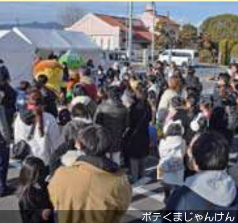
ポテくまじゃんけん