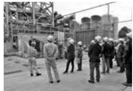
CO 2 利用回収実証設備見学

現在、国内のセメント工場では熊谷工場と同様に廃棄物の活用が進んでおり、従来のセメント製造という役割に加え、廃棄物処理という循環型社会の構築になくてはならない役割を担っていることを今回の見学で知ることができました。また、セメント製造過程では、化石燃料や石灰石の脱炭酸によりCO 2 が多く発生するため、太平洋セメント(株)では2050年のカーボンニュートラルを目指し様々な取組を行っているとのこと、今回、その研究の一部であるCO 2 利用回収実証設備に興味深く見学させて頂きました。