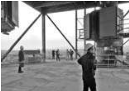
サスペンションプレヒータ上部

熊谷工場は1962年(昭和37年)7月に操業を開始して以来、60年以上に亘り、関東地方最大級のセメント工場として首都圏のインフラ整備を支えてきました。