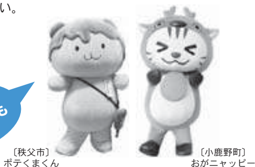
〔秩父市〕 ポテくまくん