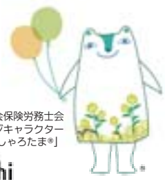
埼玉県社会保険労務士会 イメージキャラクター 「しゃろたま☆」

算定基礎届の提出期限が近づいてきました。 準備は進んでいますか？ 手続きのプロ、 社労士にお任せいただければ 正確・確実に対応いたします。 社労士が皆様を全力で サポートいたします！