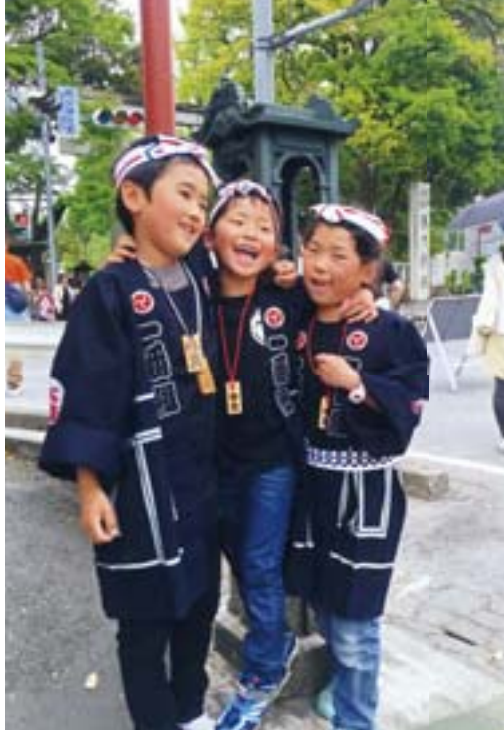
【散策サイン“開運案内板「どこいくべえ」】部門