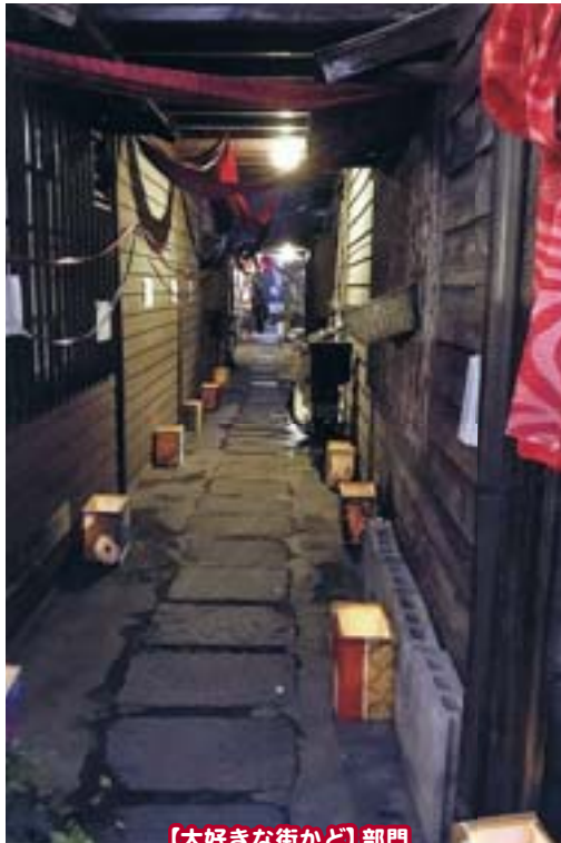
【大好きな街かど】部門